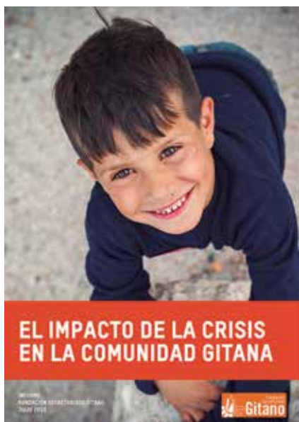
PORTADA DEL INFORME "EL IMPACTO DE LA CRISIS EN LA COMUNIDAD GITANA"

de austeridad adoptadas están afectando de manera muy significativa a los grupos con mayor desventaja, como gran parte de la comunidad gitana, con un impacto que condiciona su presente pero también su futuro , y recordando que es responsabilidad del Estado la garantía de los derechos fundamentales para toda la ciudadanía y la protección de las personas y familias más vulnerables.