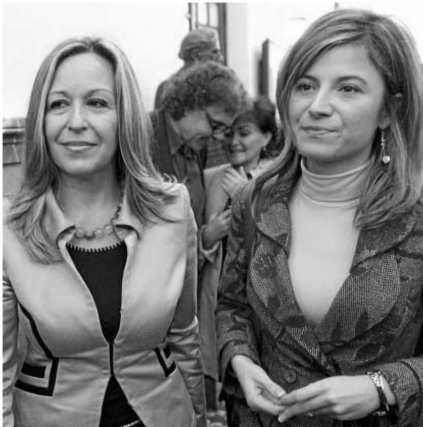
Trinidad Jiménez y Bibiada Aído, en una imagen de archivo.

“ Los brotes de gitanofobia deberían ser condenados por todas las sociedades europeas y los autores de estos crímenes, juzgados”