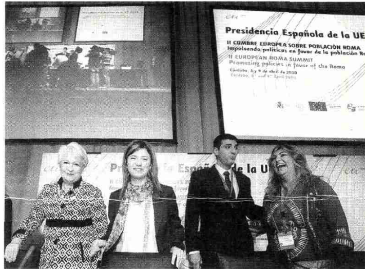
Clausura de la II Cumbre Europea sobre la Población Gitana.