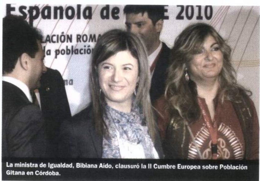
La ministra de Igualdad, Bibiana Aído, clausuró la II Cumbre Europea sobre Población Gitana en Córdoba.

ropa, que afirmaba que uno de cada dos gitanos europeos ha sufrido algún tipo de discriminación durante los últimos 12 meses. Una situación de desigualdad manifiesta que el director de este organismo, Morten Kjaerum, venía a desglosar del siguiente modo: “el 75 por ciento ha sufrido discrimi-