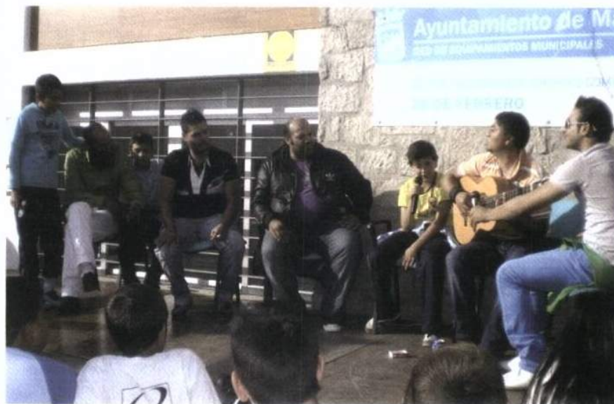
cia de enfermedades crónicas.