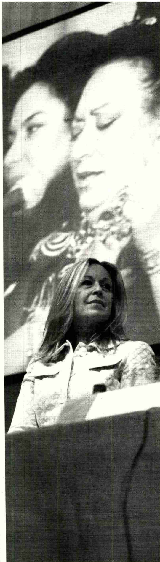
La ministra Jiménez en la inauguración de la Cumbre.

Aunque destacan los grandes avances logrados en los últimos años, los propios representantes de la asociación gitana Gao Lacho Drom, reconocen que aún resta mucha labor por hacer para eliminar prejuicios, no sólo por parte de la población, sino también por parte de cierto sector del profesorado que "da de lado" a muchos niños gitanos en las etapas iniciales de su vida académica. Actualmente, en Álava cursan estudios de Infantil 120 alumnos gitanos, 277 en Primaria, 139 en Secundaria y 29 en post obligatoria 29. De todos los niños gitanos de Vitoria, casi todos lo hicieron dentro del modelo B. >A.B.