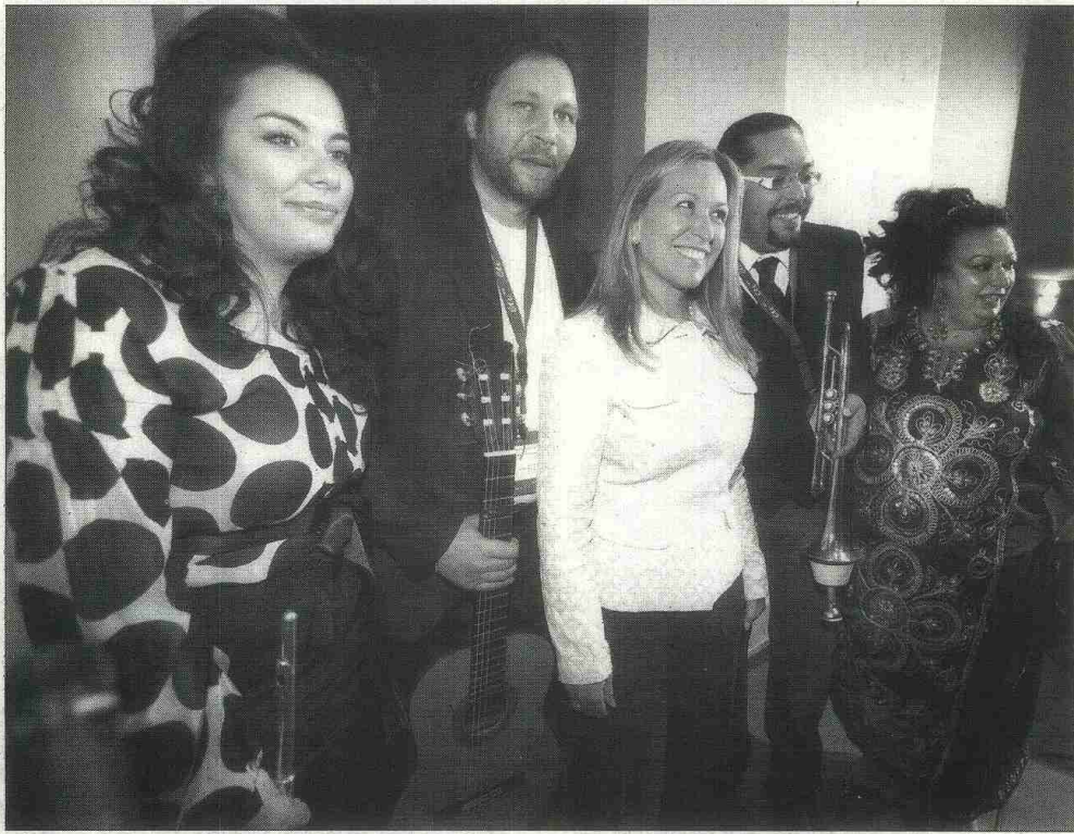
COMUNIDAD. La ministra Trinidad Jiménez con un grupo de cantantes gitanos en la II Cumbre Europea.

La ministra Trinidad Jiménez aseguró que "lo importante es conseguir que la población gitana sea vista como ciudadanos europeos, sin ningún adjetivo más", por lo que apostó por "hacer visible" la identidad "real" del pueblo gitano, que muchas veces se relaciona con acciones y actitudes que nada tienen que ver