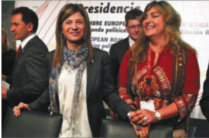
La ministra Bibiana Aído (izquierda), que cerró ayer la cumbre.