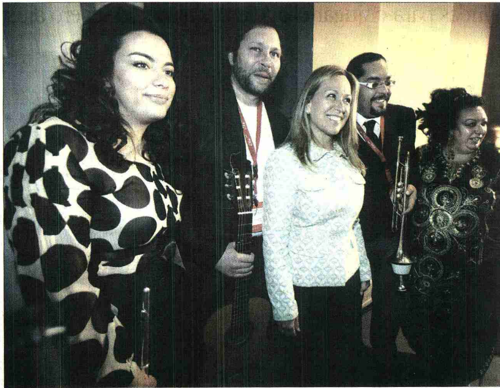
COMUNIDAD. La ministra Trinidad Jiménez con un grupo de cantantes gitanos en la II Cumbre Europea.

La ministra Trinidad Jiménez aseguró que "lo importante es conseguir que la población gitana sea vista como ciudadanos europeos, sin ningún adjetivo más", por lo que apostó por "hacer visible" la identidad "real" del pueblo gitano, que muchas veces se relaciona con acciones y actitudes que nada tienen que ver