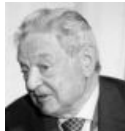
▶▶ George Soros.

—Creo que es el momento de que las bonitas palabras utilizadas aquí en Córdoba se traduzcan en hechos, hay que pasar a la acción. El éxito de esta cuestión dependerá de que sus con-