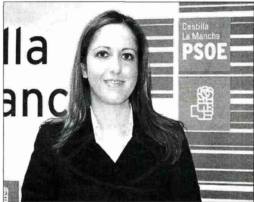
La senadora socialista Cristina Maestre

Es necesario que trabajamos con ellos, escuchamos sus propuestas y C-LM es una de las comunidades autónomas donde hace más tiempo que se está trabajando en la integración social como el programa Acceder e Interregional de Integración