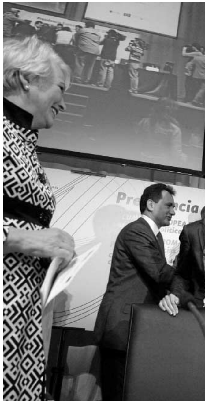
Bibiana Aído, acompañada de ministros de otros países, durante la clausura.

Por otra parte, el director de la Agencia Europea de Derechos Fundamentales (FRA), Morten Kjaerum, afirmó que es preciso mejorar la integración del pueblo gitano, haciéndolo partícipe de las decisiones de la sociedad civil, para acabar con la discriminación que la mitad de ellos sufre en Europa, informó Efe. Para evaluar el grado de exclusión, la FRA realizó en 2008 un estudio en el que se encuestó a 23.000 inmigrantes y personas de minorías étnicas en una muestra compuesta por países en los que un 10% por ciento de su población es gitana y se reveló que uno de cada dos romaníes habían sido objeto de discriminación en el último año en una media de 11 veces. Además, más de la mitad de los gitanos víctimas de violencia racista no habían denunciado el caso, principalmente porque pensaban que no serviría.