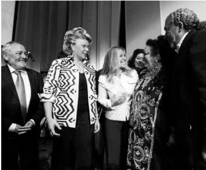
La ministra, el alcalde y la comisaria de Justicia saludan a unos músicos.

En Europa residen 12 millones de gitanos y en España, alrededor de 700.000, la mitad de los cuales viven en Andalucía. Esto supone