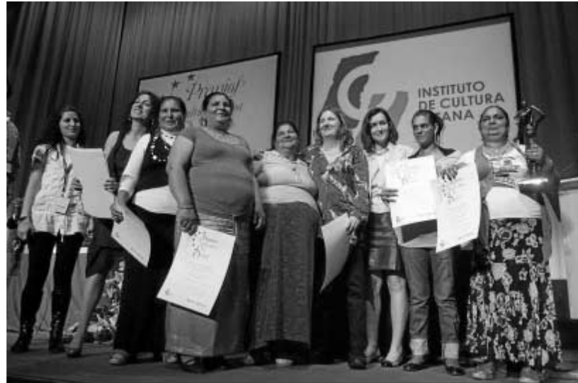
Las mujeres de Teatro Atalaya recogen su condecoración.

Teatro Atalaya, El Lebrijano, José Córdoba o el grupo de hip hop La Excepción reciben los premios 8 de abril