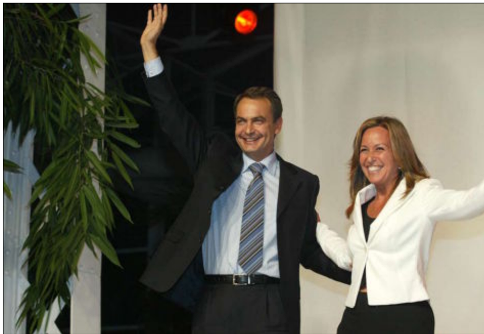
José Luis Rodríguez Zapatero y Trinidad Jiménez, grandes valedores del acto.

Durante mucho tiempo pareció haberse descarta-