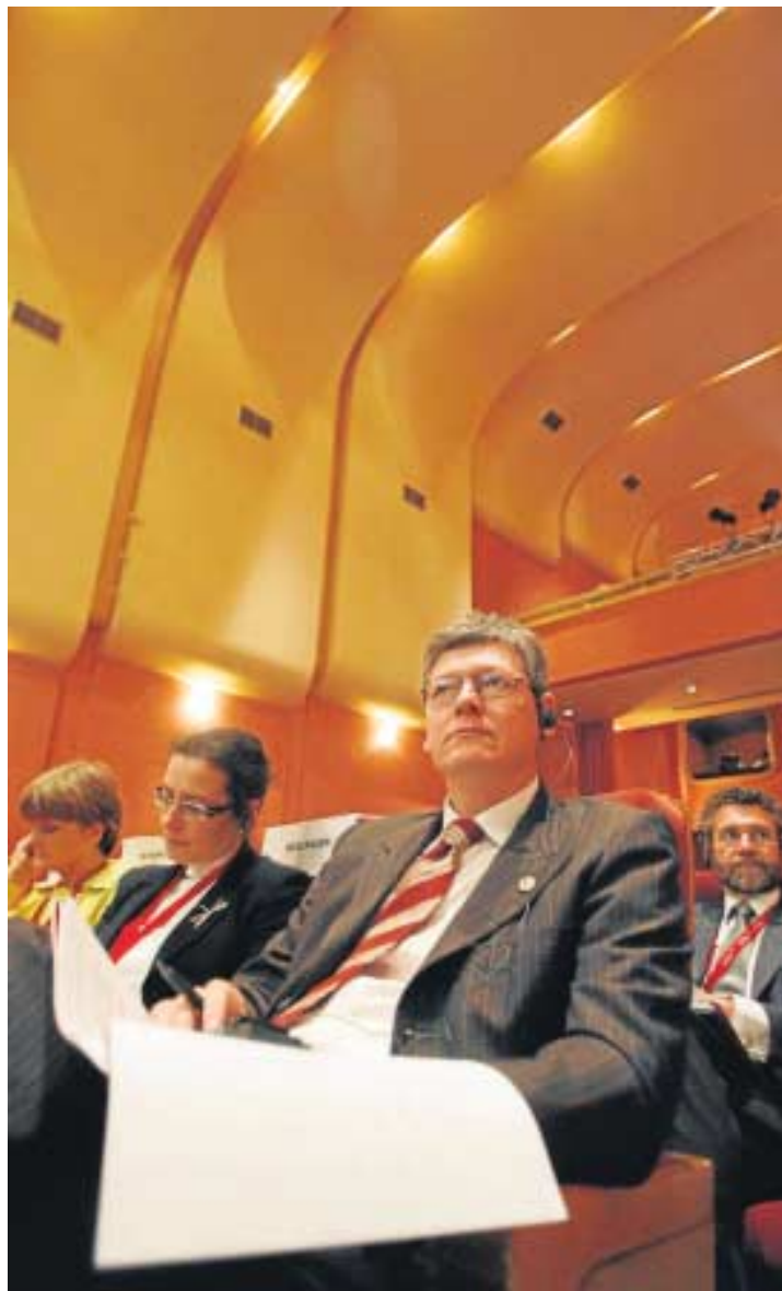
El comisario Andor, durante la jornada de conclusiones.

–¿Y cómo es la situación en España en comparación con otros estados miembros?