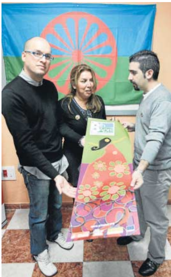
Representantes de los colectivos gitanos, ayer en Córdoba.

Los colectivos subrayaron que la Unión Europea y la sociedad “no pueden tolerar tan altas cotas de justicia y desigualdad acumuladas en una minoría que tiene en común su pertenencia étnica,