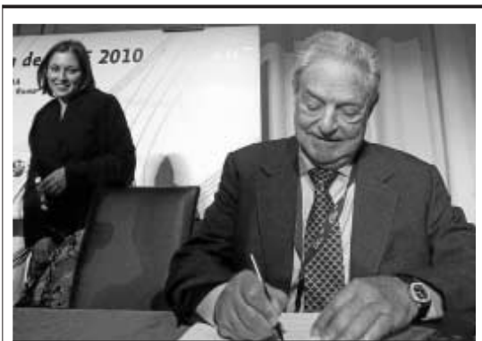
El financiero George Soros, durante la mesa redonda.

La sanidad y la vivienda son los otros tres pilares del programa. La ministra recordó que, tal y como ocurre en otras clases sociales desfavorecidas, entre la población gitana una mayor incidencia de enfermedades crónicas generales, sobre todo cardiovasculares. "Las políticas públicas tienen aquí un papel importante, porque pueden reorien-