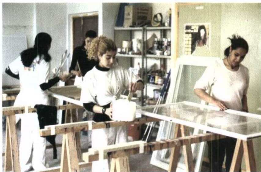
El volumen de mujeres gitanas inactiva supera el 70 por ciento.

pa. Así, según el Informe 2009 de la Agencia de la Unión Europea para los Derechos Fundamentales, en Hungría una compañía fue multada por negarse a contratar a tres candidatos a limpiadores por su origen gitano. Por su parte, una encuesta publicada en 2008 mostró que cerca del 41 por ciento de las grandes empresas de Lituania no contrataría a un apersona gitana. Y en lo que respecta a la República Checa, según el European Roma Rights Centre y la Roma Education Fund, el 80 por ciento de los alumnos de las escuelas especiales para niños con discapacidad de este país son gitanos, cuando éstos no padecen ninguna discapacidad mental.