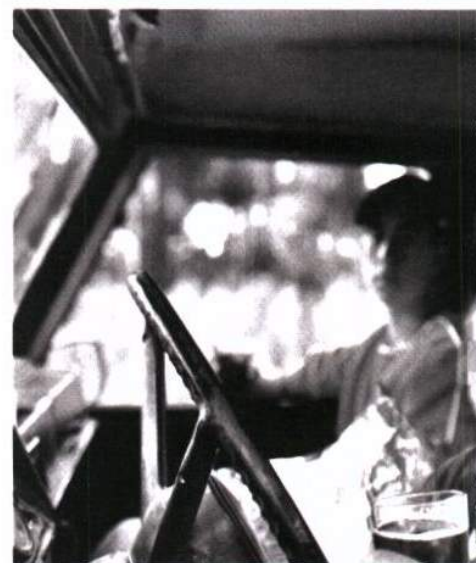
Entre la población gitana hay una mayor incidencia de alcoholismo.

signa el reconocimiento efectivo de los derechos y deberes de estos ciudadanos, pero sin olvidar solicitar al pueblo gitano su colaboración en la elaboración de los proyectos destinados a combatir y erradicar la discriminación que sufren desde hace décadas.