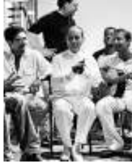
El pueblo romaní es una pieza imprescindible en la construcción histórica y cultural de Extremadura

La oportunidad que ofrece la Unión Europea a la comunidad gitana encuentra su escenario en la ciudad de Córdoba que, coincidiendo con el Día Internacional de los Gitanos, alberga la II Cumbre Europea sobre Acciones y Políticas a favor de la