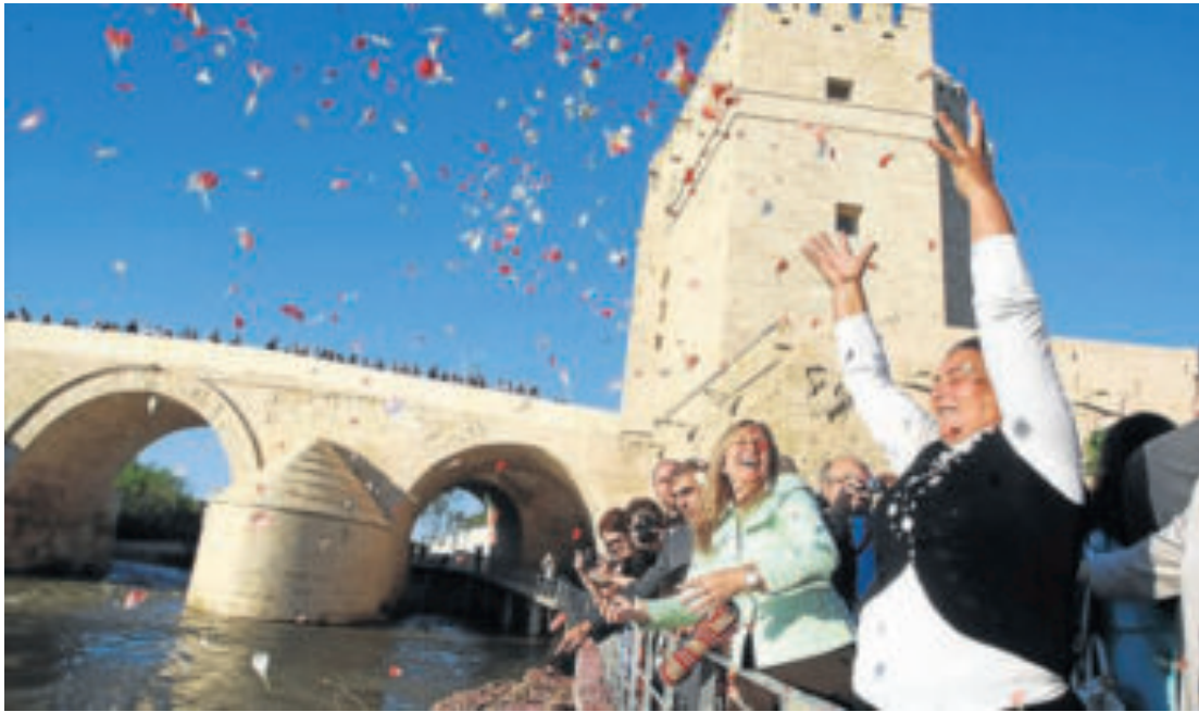
► El entorno de la Calahorra fue ayer escenario de la tradicional ceremonia del río de los gitanos, en la que participó la ministra Jiménez.