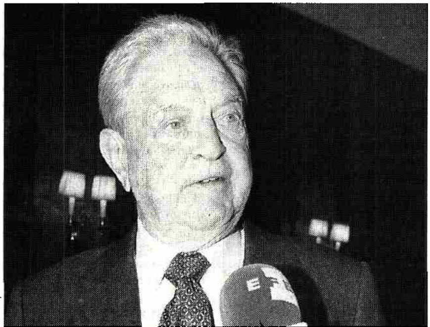
El financiero y filántropo George Soros

"En todos los países donde viven gitanos, la población autóctona les es hostil", según George Soros, que mañana en Córdoba destacará en un discurso que, a pesar de que se han tomado decisiones judiciales que ordenan que se hagan reformas, "se sigue