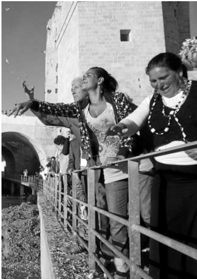
REPORTAJE GRÁFICO. ALVARO CARMONA

González-Sinde dice que las costumbres españolas y europea "no pueden comprenderse" sin la tradición gitana