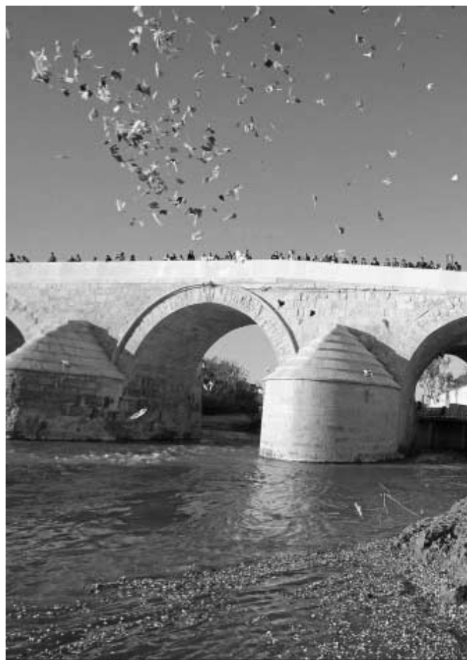
Los gitanos celebran su día arrojando flores al río, símbolo de trashumancia.

La perspectiva de género también está recogida en el plan, pues las mujeres gitanas inactivas son más del 70% pese a que en el plano educativo, y como ocurre en el resto de la población, "son las jóvenes quienes obtienen mejores resultados académicos en relación con los jóvenes de su misma edad". La tradición, sin embargo,