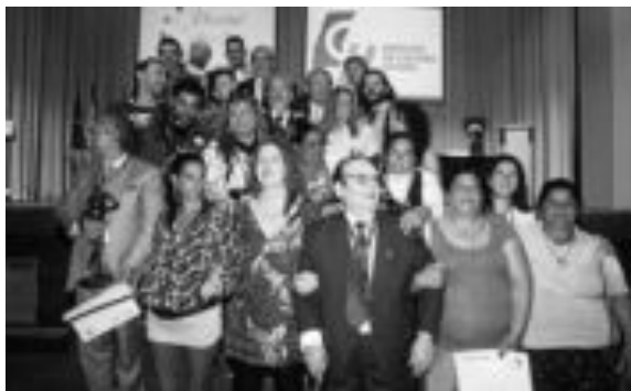
▶▶ Foto de familia ▶ Los premiados posan juntos con las autoridades.