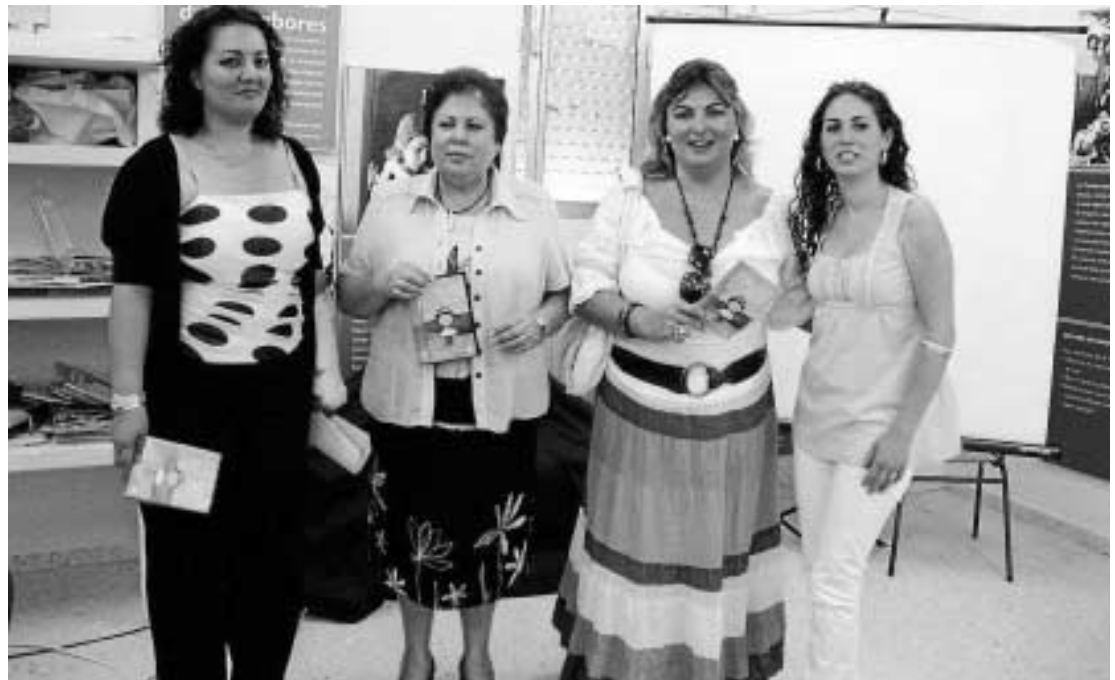
Presentación en Huelva de un DVD interactivo realizado por Amuradi sobre las mujeres gitanas de hoy. M. R. CASCALES

En España, en la actualidad hay censados un millón de gitanos, aunque en esta cifra no se inclu-