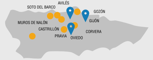
Sedes FSG-Asturias: AVILÉS. GIJÓN. OVIEDO. Castrillón, Corvera, Gozón, Muros de Nalón, Pravia y Soto del Barco