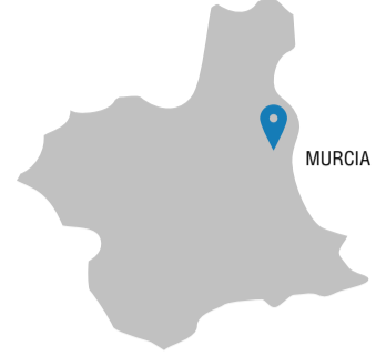
Sedes FSG-Murcia: Murcia