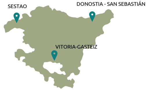
Euskadiko FSG-ko Lurralde – egoitza