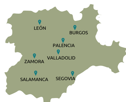
FSG-Castilla y León