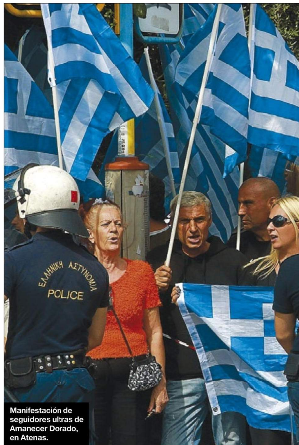
Manifestación de seguidores ultras de Amanecer Dorado, en Atenas.

No ayudan la debilidad de las instituciones europeas, vaciadas de contenido y de esperanza, alejadas cada vez más del sueño de una casa común. Tampoco ayuda el desprecio de la política, sobre todo en el sur, donde más crece la xenofobia.