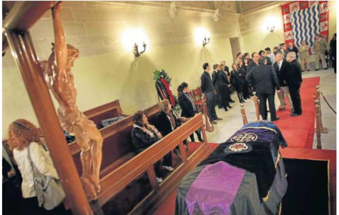
Algunas de las personas que se acercaron ayer al Cabildo a despedir al compositor.