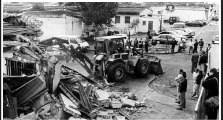
▲ Primeras demoliciones. En 1994 se llevaron a cabo los primeros realojos y, posteriormente, los derribos de las casas que iban quedando vacías. Objetivo: acabar con el gueto.