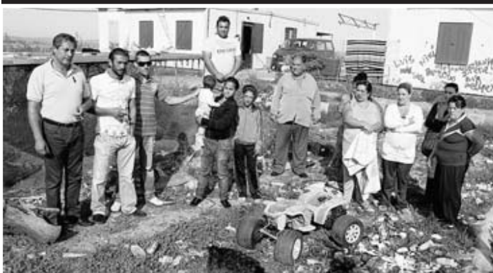
▲ Los últimos de Las Cuestas. Octubre de 2009. Se negaban a ser realojados en Los Colorines alegando que ellos, por los menos, vivían pacíficamente.