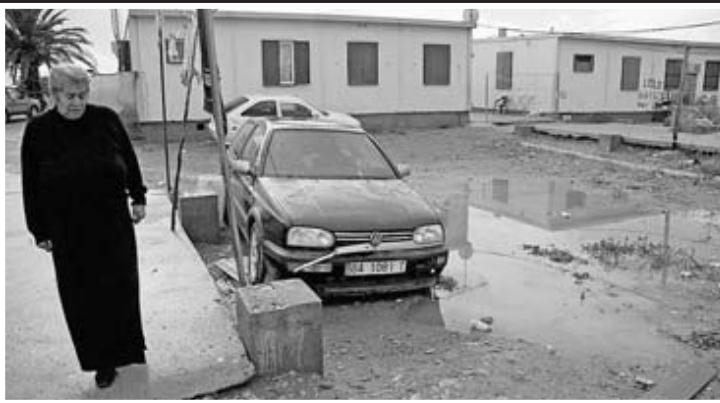
▲ Surge un nuevo gueto. Después de eliminar los albergues provisionales, en 2002 la Junta sorprendió con otro proyecto: 34 viviendas modulares junto a las recién derribadas.