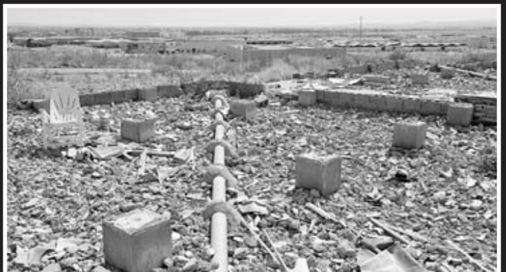
▲ Situación actual. El gueto de Las Cuestas de Orinaza ha sido eliminado por completo. Esta zona se convertirá en la ampliación del polígono industrial El Nevero.