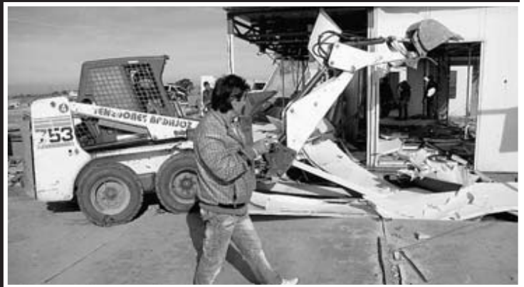
▲ Derribos, otra vez. A finales del pasado año empezó el segundo derribo (y, en principio, definitivo) de Las Cuestas de Orinaza. Seis familias resistían.