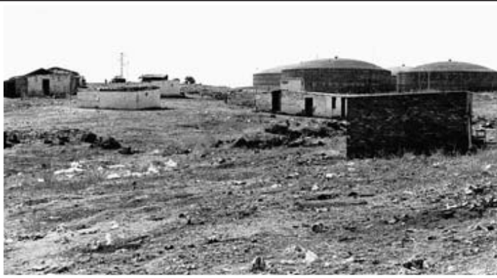
▲ Chabolas junto a la carretera de Campomayor. El 'barrio' de Las Cuestas de Orinaza se creó para erradicar el chabolismo en Badajoz de finales de los años setenta.