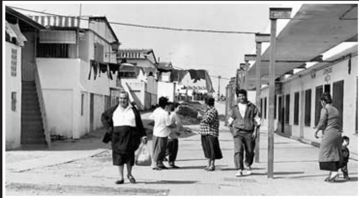
▲ De estreno. Las Cuestas consistían en 400 viviendas (llamadas albergues provisionales) que fueron sorteadas y entregadas en 1980.