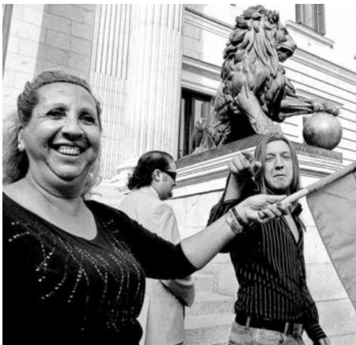
Representantes de asociaciones gitanas se manifiestan en el exterior del Congreso de los Diputados.

Rodríguez reconoce que el modelo español está lejos de ser perfecto, pero "es el menos malo, comparado con la mayoría de los países europeos. Aquí se ha garantizado que los derechos universales lo sean también para los gitanos y se han puesto en marcha programas para compensar las desigualdades".