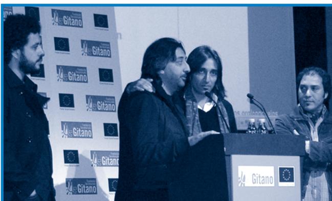
Los "artistas" del Videoclip