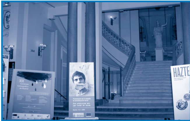
Entrada al Círculo de Bellas Artes