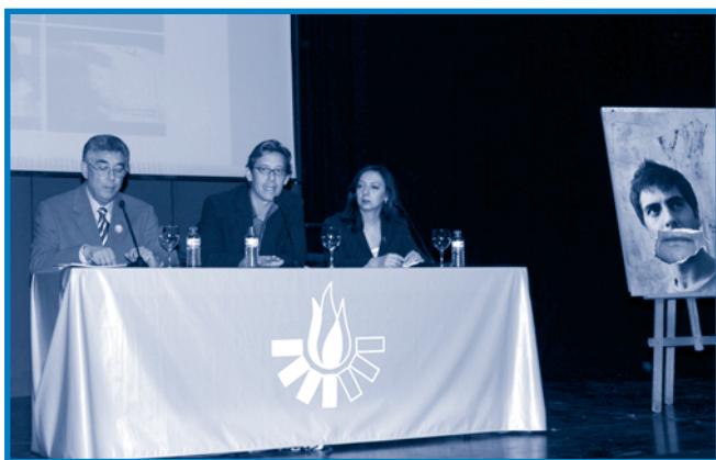
Rueda de prensa