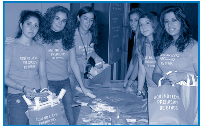
Azafatas de la FSG

A continuación se obsequió a los asistentes (más de 200 personas) con un cocktail y, a medida que los iban saliendo, las azafatas gitanas del programa de la FSG "Ecotur" les entregaban una bolsa de la campaña con los distintos objetos promocionales de la campaña. ■