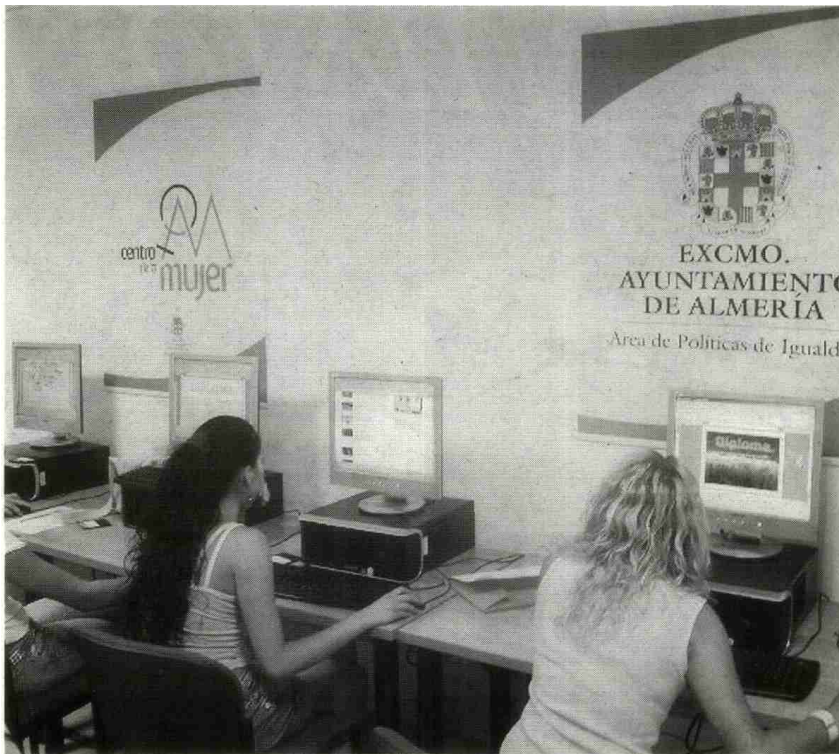
Un grupo de muchachas trabaja con Internet en unas dependencias del Ayuntamiento