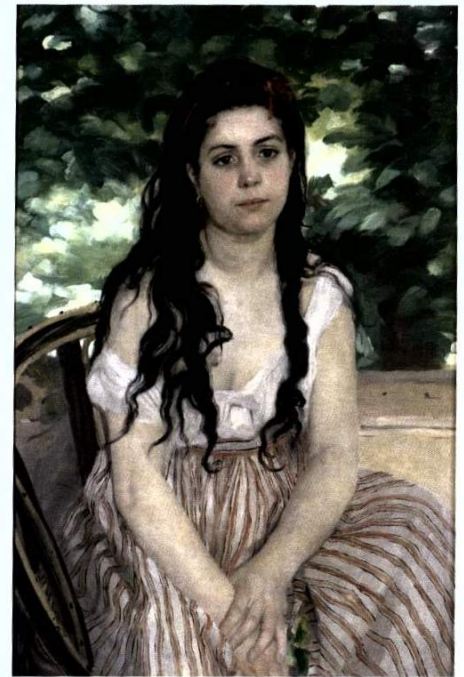
Pierre Auguste Renoir. "En été - La Bohémienne", 1868, óleo sobre tela.