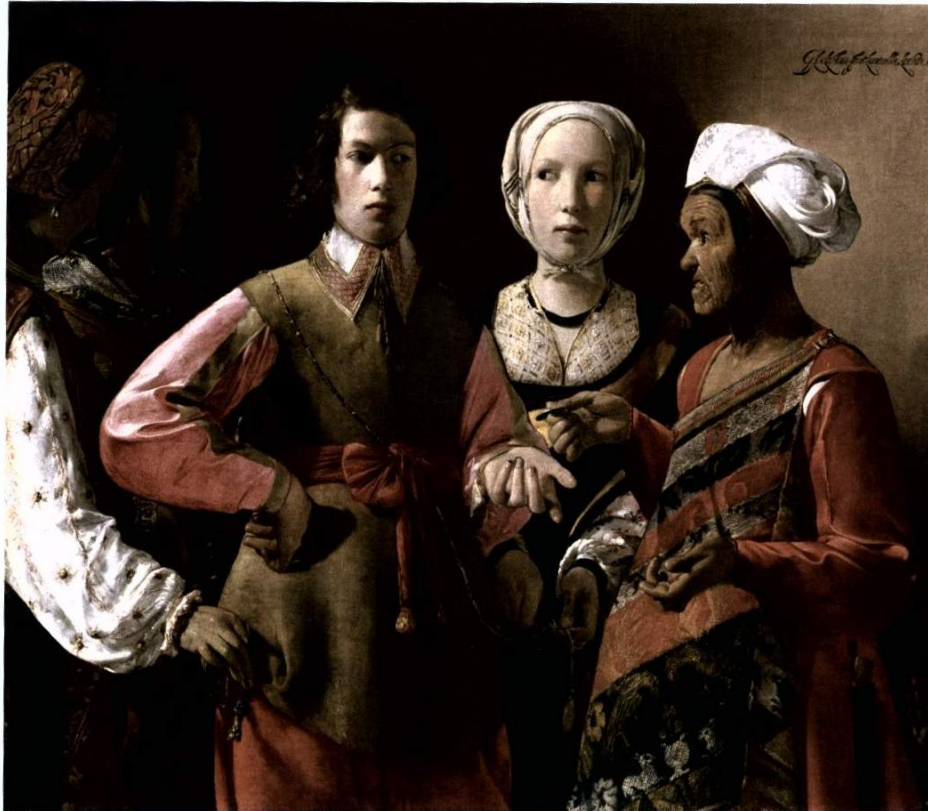
Georges de la Tour. "La diseuse de bonne aventure", ca. 1630, óleo sobre tela.