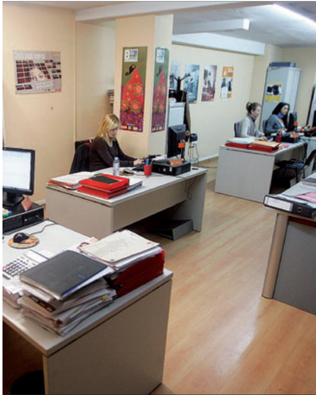
Las acciones abarcan un amplio abanico de ámbitos.