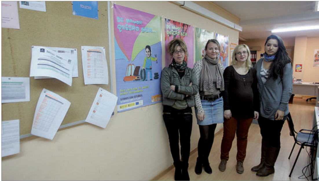
Trabajadoras de la delegación en Talavera de la Fundación Secretariado Gitano.