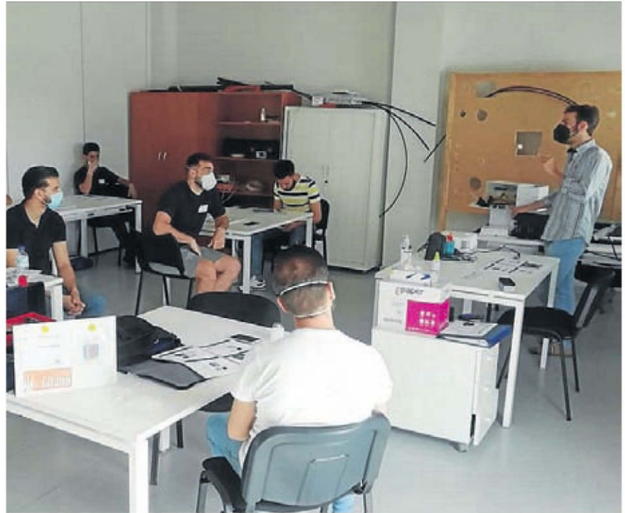
▶ Alumnos del curso de instalador de fibra óptica en una clase.

Se trata de una actividad formativa financiada por el Programa Operativo de Empleo Juvenil del Fondo Social Europeo y Fun-