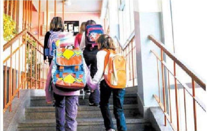
Esta entidad propone elevar el presupuesto destinado a Educación y a becas.