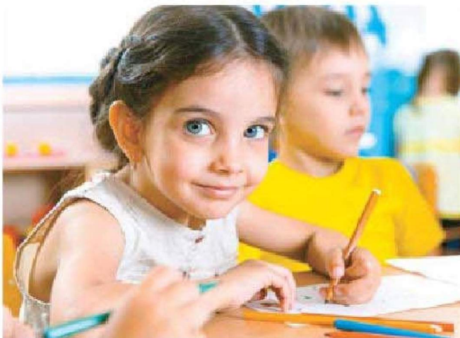
La escolarización infantil es clave para potenciar la equidad en el sistema educativo.

Save the Children tampoco deja de lado que existe una desigualdad territorial. Así, País Vasco (9,4%) y Cantabria (10,3%) son autonomías que han alcanzado el objetivo europeo mientras que otras comunidades, como Andalucía (27,7%) o las Islas Baleares (32,1%), están muy lejos de alcanzar dicho objetivo.