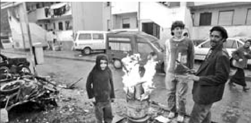
Fuente: Mapa sobre vivienda y comunidad gitana en España 2007