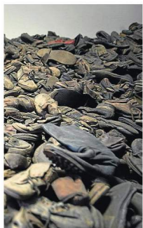
LOS NIÑOS. Montañas formadas por miles de zapatos infantiles se muestran en los barracones. Los cadáveres eran despojados de todas sus pertenencias antes de ser incinerados.

el 20 de enero de 1942 presidida por Reinhard Heydrich, al que sus propios hombres de las SS apodaban «la bestia rubia». A los pocos días de recibir la orden, en Auschwitz se empezó a gasear a miles de judíos y a partir de junio de 1942 se decidió ampliar las instalaciones para poder internar a 200.000 presos al mismo tiempo. En octubre de ese mismo año Himmler ordenó trasladar a todos los judíos a los campos de exterminio polacos.