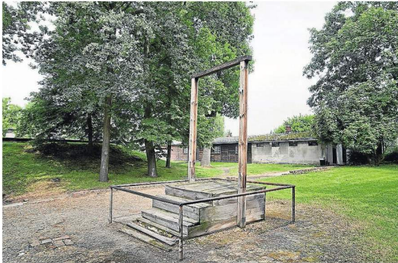
LA HORCA. La horca que sirvió para ejecutar a Rudolf Höss en abril de 1947 está situada al lado de una cámara de gas. Los supervivientes aseguraron que Höss era un hombre frío capaz de dirigir impecablemente aquella máquina de matar.

TRADA AL HORROR. Hei- nrich Himmler lo eligió como principal campo de exterminio por su privilegiada ubica- ción (nudo ferroviario) como la posibilidad de aislamiento y camuflaje.