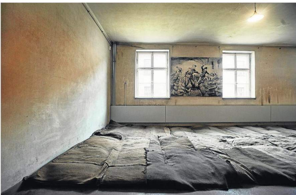
COLCHONES EN EL SUELO. Los presos ocupaban los edificios y también se hacían en sótanos y desvanes. Hoy todas las instalaciones son un imprescindible museo que muestran las condiciones de vida de los prisioneros.