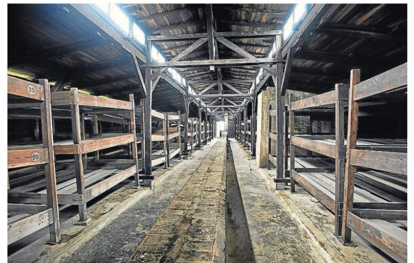
BARRACONES. Barracón perteneciente al complejo Auschwitz II-Birkenau donde se hacían entre 400 ó 500 prisioneros en condiciones execrables. Muchos murieron como consecuencia del hambre, las enfermedades, los castigos y las torturas.