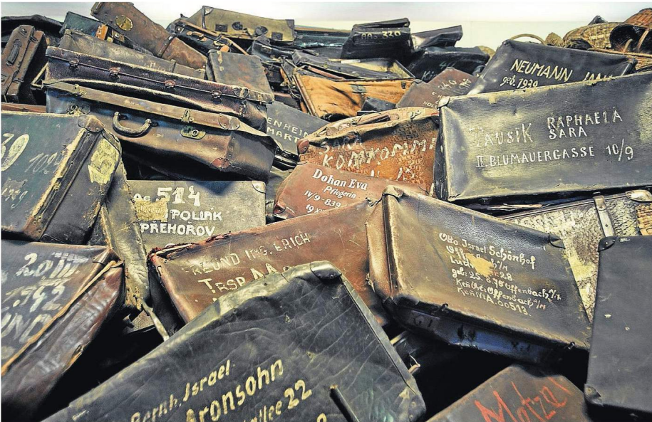
LAS VÍCTIMAS. 1.700 kilos de cabello femenino están expuestos en uno de los barracones. En otro hay centenares de maletas con los nombres y las direcciones de las víctimas.