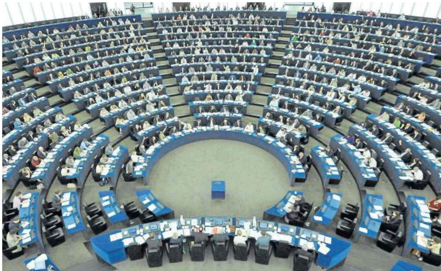
Imagen de archivo del Parlamento Europeo.

De los 751 eurodiputados con los que contará el nuevo hemiciclo, 372 se sentarán por primera vez hoy en los sillones de Estrasburgo