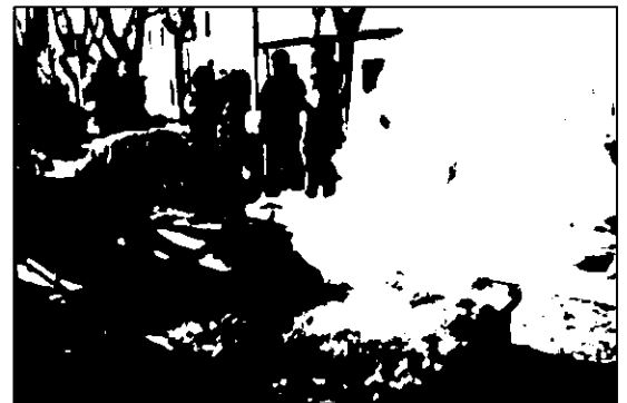
Degustación gastronómica en Olivares.

Poesía, cuentos, magia y la tradicional ceremonia del río desde el nuevo puente con la que la comunidad arroja flores naturales al río en recuerdo de los antepasados son algunas de las actividades protagonizadas por la comunidad gi-