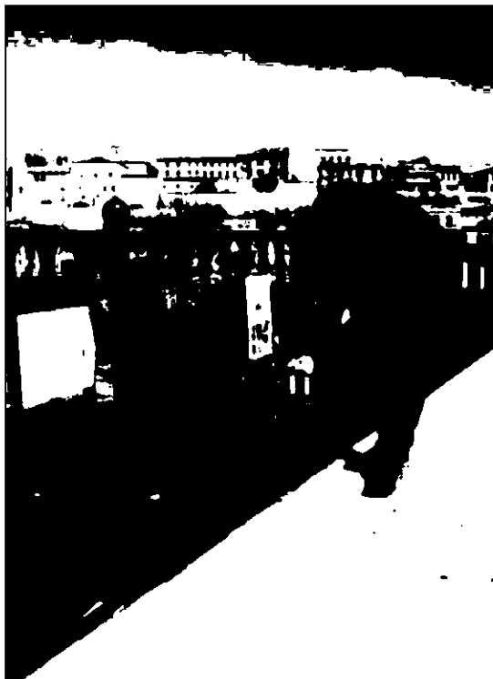
Colocación de dibujos infantiles en el Puente de Piedra.

Un año más, Zamora se suma a la celebración junto a la Fundación Secretariado Gitano, Ayuntamiento, Centro Menesianos Zamora Joven y Cruz Roja, en colaboración con la Asociación de Vecinos de Olivares, Multicines Zamora y el merendero de Las Espadañas. La celebración ha supuesto en los últimos años una importante ocasión para el reconocimiento de los gitanos, su historia,