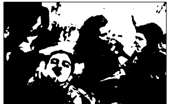
Taller de pintura para niños.

tana de Zamora. «Los ojos de la interculturalidad» es el título del concurso de dibujo desarrollado en diferentes centros escolares de Zamora y que tienen como escenario perfecto el Puente de Piedra, en el que ayer prendían los dibujos escolares. Parrillada, degustación gastronómica y entrega de pre-