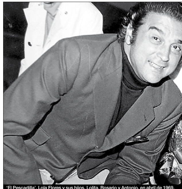
'El Pescadilla', Lola Flores y sus hijos, Lolita, Rosario y Antonio, en abril de 1969.