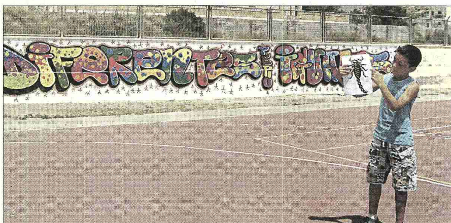
■ El pequeño José enseñando su dibujo frente al grafiti que realizaron los alumnos: 'Diferentes pero iguales'.