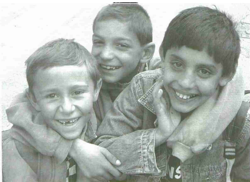
Los niños gitanos se enfrentan a menudo a la discriminación y el racismo.