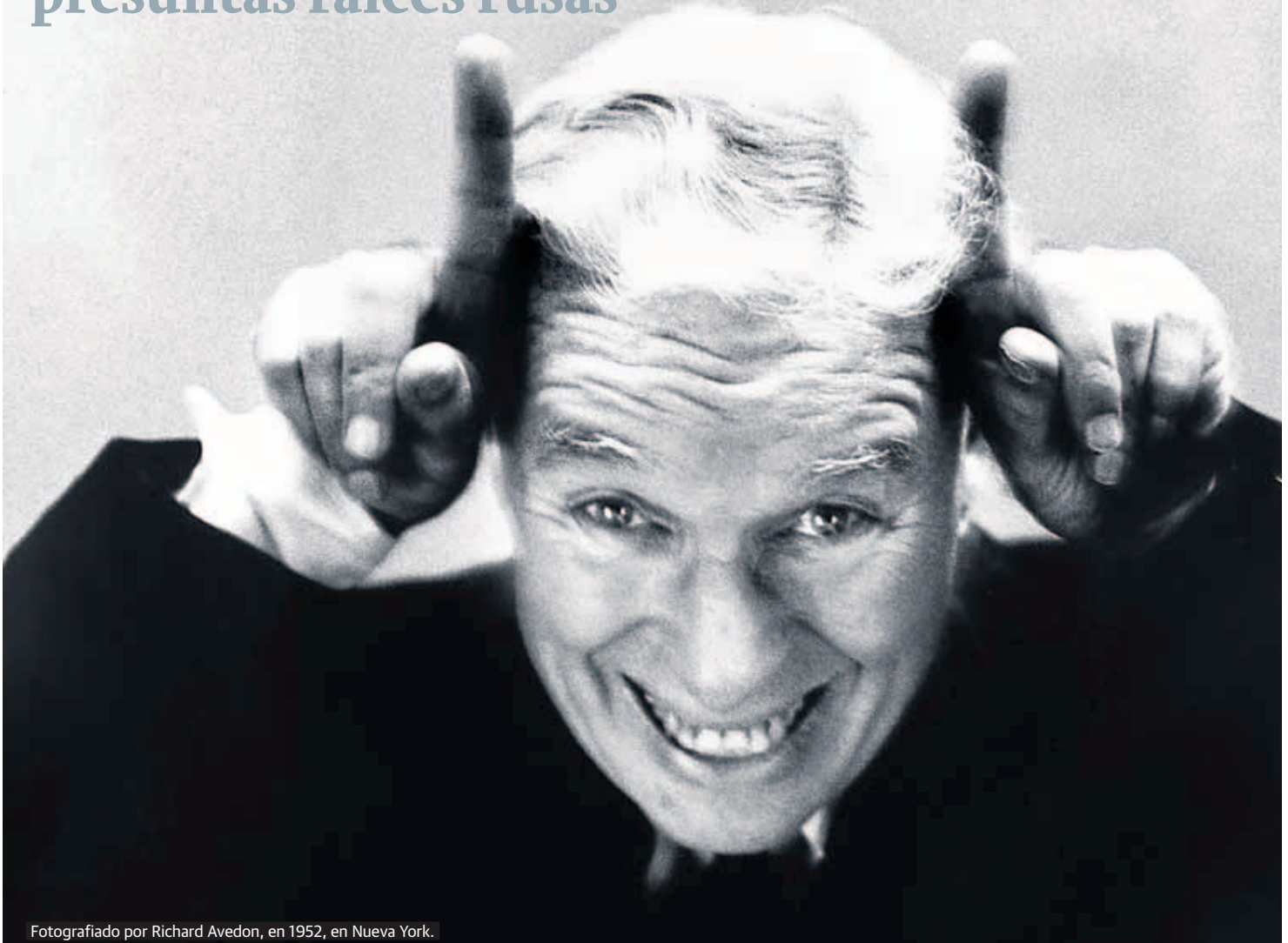
Fotografiado por Richard Avedon, en 1952, en Nueva York.

D ónde nació Charles Chaplin? ¿Es posible que el más célebre de los actores del cine mudo tenga su cuna en Francia? ¿Llegó al mundo en Londres? ¿O fue tal vez en un campamento de gitanos en el centro de Inglaterra? ¿Se apellida realmente Chaplin el genial autor, intérprete y productor de una treintena de comedias y parodias? Un torrente de misterios acerca del origen y trayectoria del gran Charlot ha vuelto a explotar con la apertura de los ficheros confidenciales de los servicios secretos británicos. Recogidos por la agencia de inteligencia MI5, los documentos hasta ahora secretos se pueden inspeccionar a