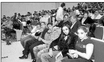
Público asistente al «Día internacional del pueblo gitano».

Orgullo y «una cosa buena, buena». Ser gitano se puede explicar con palabras, pero sobre todo bailando y cantando. Decenas de calés se reunieron ayer en la Casa de Cultura «Teodoro Cuesta» para celebrar el «Día internacional del pueblo gitano». El acto incluyó un concierto de Antonio Suárez, «Guadiana».