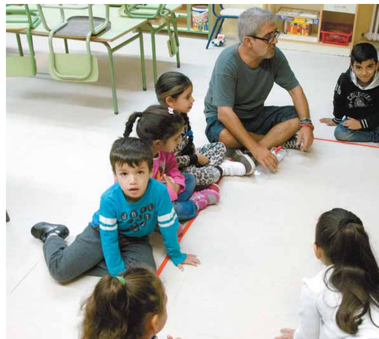
Sí ha habido una evolución positiva en cuanto a la escolarización temprana.

A lo largo de este curso 2014-15, los niños ofrecerán varias actuaciones, como ya hicieron los profesores de instrumentos que acuden al centro en la jornada de presentación del proyecto, el pasado mes de junio. Una cita que unió a alumnado, profesores y familias con todo el entorno social del Colegio "Manuel Núñez de Arenas".