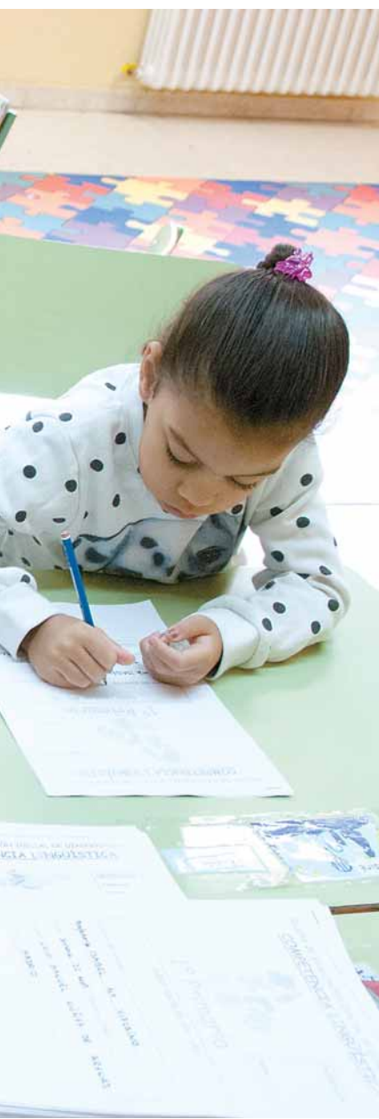
...nia gitana.