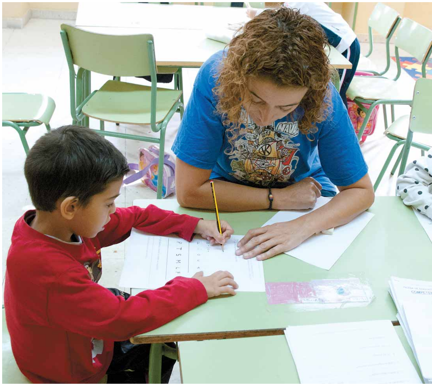
De los 110 niños que forman el alumnado del Colegio "Manuel Núñez de Arenas, calificado como de Dificil Desempeño, el 80% son de etnia gitana.

La implicación de las familias en la Educación de sus hijos es un mantra para el centro, y no dejan de fomentar su participación, aunque el grado siempre es más bien bajo. Acuden a las reuniones de manera irregular, son pocos los padres que participan en los talleres