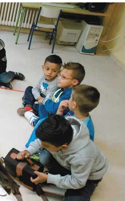
...ana de los niños en los últimos años.