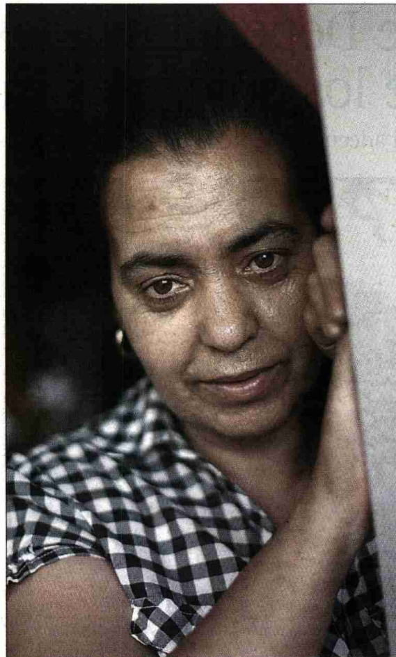
La Nena, ayer en su casa, en Madrid.

"El Instituto Nacional de la Seguridad Social (INSS) le dijo que