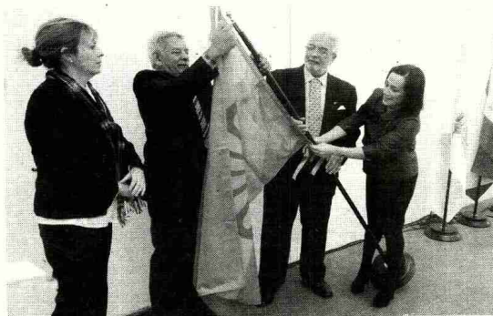
Momento en el que colocaron la bandera del pueblo gitano.

Jiménez afirmó que "un pueblo no evoluciona hasta que adquiere conocimiento", por lo que opinó que "es hora de que nos asentemos y nuestros niños vayan al colegio". De esta manera, manifestó, "podre-