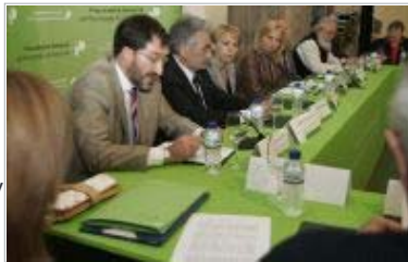
COLABORACIÓN. Un momento de la firma del convenio, ayer.