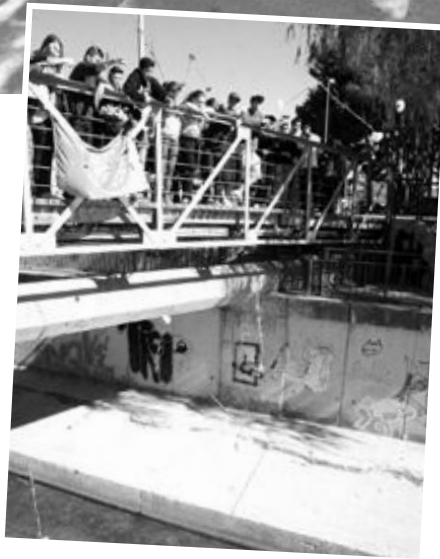
Los asistentes lanzaron claveles al río Isuela.

“Los gitanos llegamos a España incluso antes de la unifi-