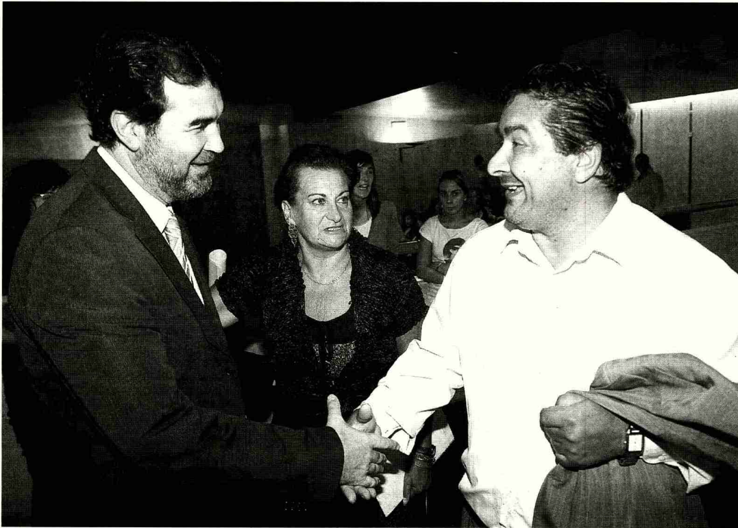
Este plan, que conta cun orzamento de 181 millóns de euros, foi presentado recentemente polo vicepresidente da Xunta, Anxo Quintana.

O Plan Integral para a convivencia e o desenvolvemento social do Pobo Xitano de Galicia, que conta cun orzamento que supera os 800.000 euros este ano e que, de aquí ao 2013, suporá un investimento mínimo de 5,6 millóns de euros, ten como obxectivo converterse nun instrumento específico que ten como meta a normalización das condicións de vida das xitanas e xitanos de Galiza, mellorando a súa incorporación efectiva aos servizos da sociedade do benestar, canalizando o desenvolvemento da súa propia identidade cultural