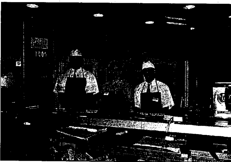
Diez personas participaron en 2005 en el curso de personal de supermercados

oficios, señalan desde la Fundación Secretariado Gitano .