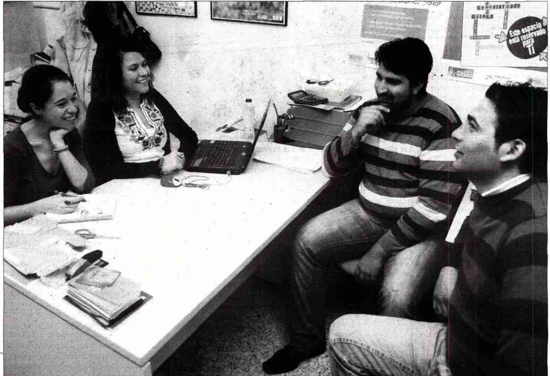
Miembros de Secretariado Gitano y de la Asociación Cultural Cristiana debaten los puntos de acción de sus respectivos programas.

El área sociolaboral de Secretariado Gitano cuenta con recursos de orientación y búsqueda de empleo, que van desde la impartición de talleres colectivos y prácticos para enfrentarse a las entrevistas de trabajo, a la ayuda individual en la elaboración de currículum y cartas de presentación, búsqueda activa de empleo a través de Internet y envío de solicitudes. Aunque