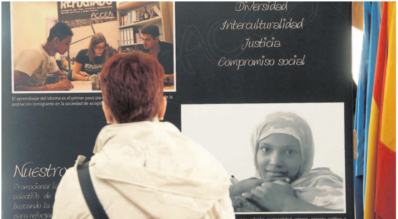
Una de las primeras visitantes a la exposición inaugurada ayer en el pasillo central de las Cortes de Castilla y León.