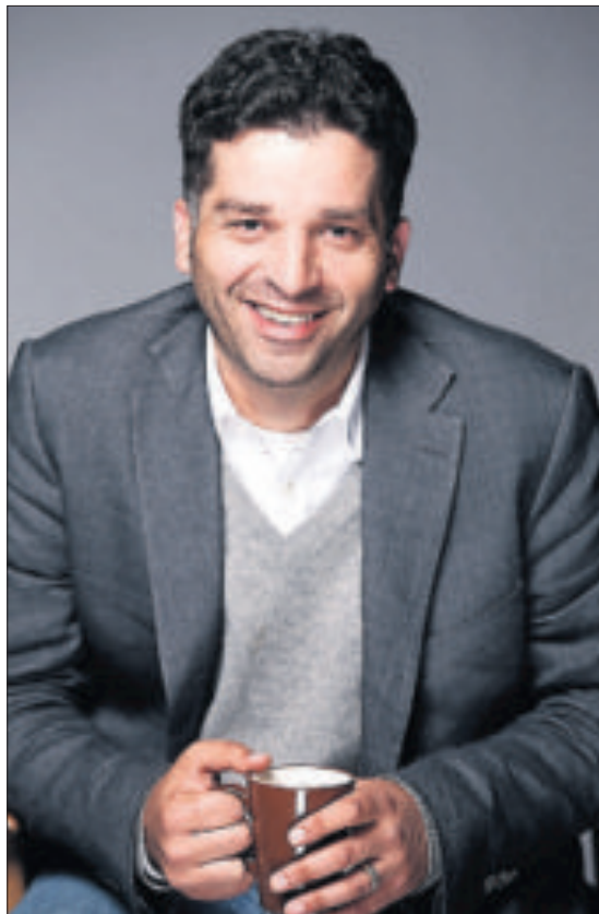
El director bosnio Danis Tanovic.

“No me podía creer la historia, aún no me lo creo... Aunque vivo en un país en el que cualquier cosa es posible: si me dicen que desaparece en Bosnia la ley de la gravedad, no me chocaría”. Danis Tanovic (Zenica, 1969) ha tenido una carrera errática desde su imperial debut con En tierra de nadie . Y puede que La mujer del chatarrero , gran premio del jurado y galardón al mejor actor en la Berlinale de 2013, le devuelva a la senda correcta. Tras años viviendo en París, se mudó hace poco de vuelta a Sarajevo, y sintió de nuevo la locura balcánica. “Leí en el periódico la historia de esta mujer gitana que necesita un legrado y que no encuentra ayuda en ninguna parte”. Su marido, chatarrero, batalla contra la burocracia. “Le dije a mi productor: ahí está mi próxima película. Fui al pueblo y todo era cierto. Decidí no hacer el documental, y aunque ellos decían que no sabían actuar, ¡todo el mundo actúa! Nuestras caras cambian si nos ponen una cámara delante. La familia me decía: ‘Nunca hemos hecho esto’, a lo que les respondí: ‘Yo tampoco’.