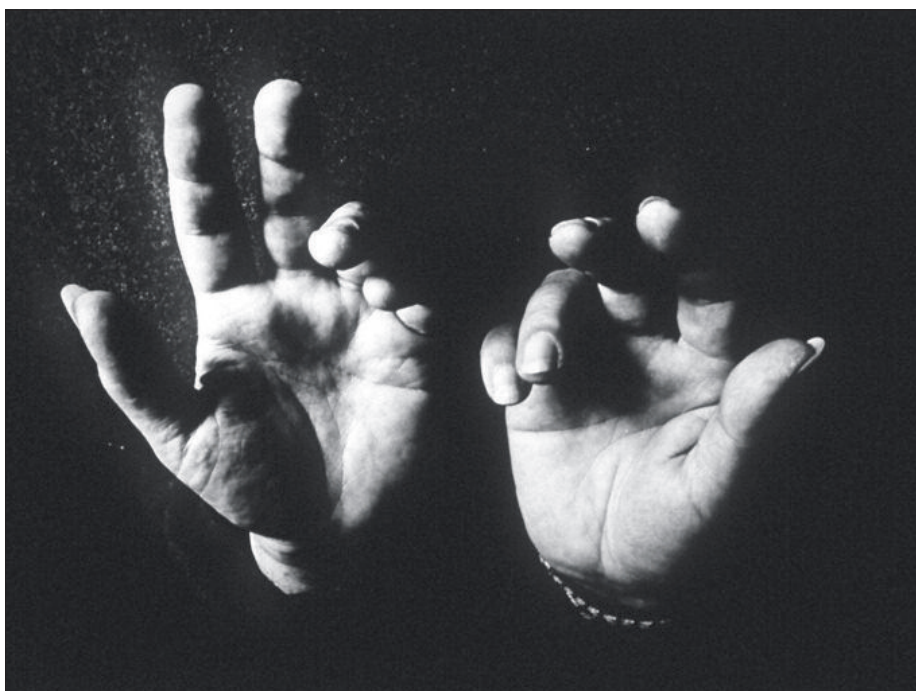
Las manos de Paco de Lucía, fotografiadas por Francis Giacobetti.

Algunos desaprensivos habían intentado enfrentar a Paco con la familia de su amigo a la muerte de este, verano de 1992, acusando a los Sánchez de haber cobrado derechos de autor que pertenecían a Camarón. La injusticia deprimió a Paco durante meses, pero no consiguió borrar el cariño y la admiración que el toacaor, que