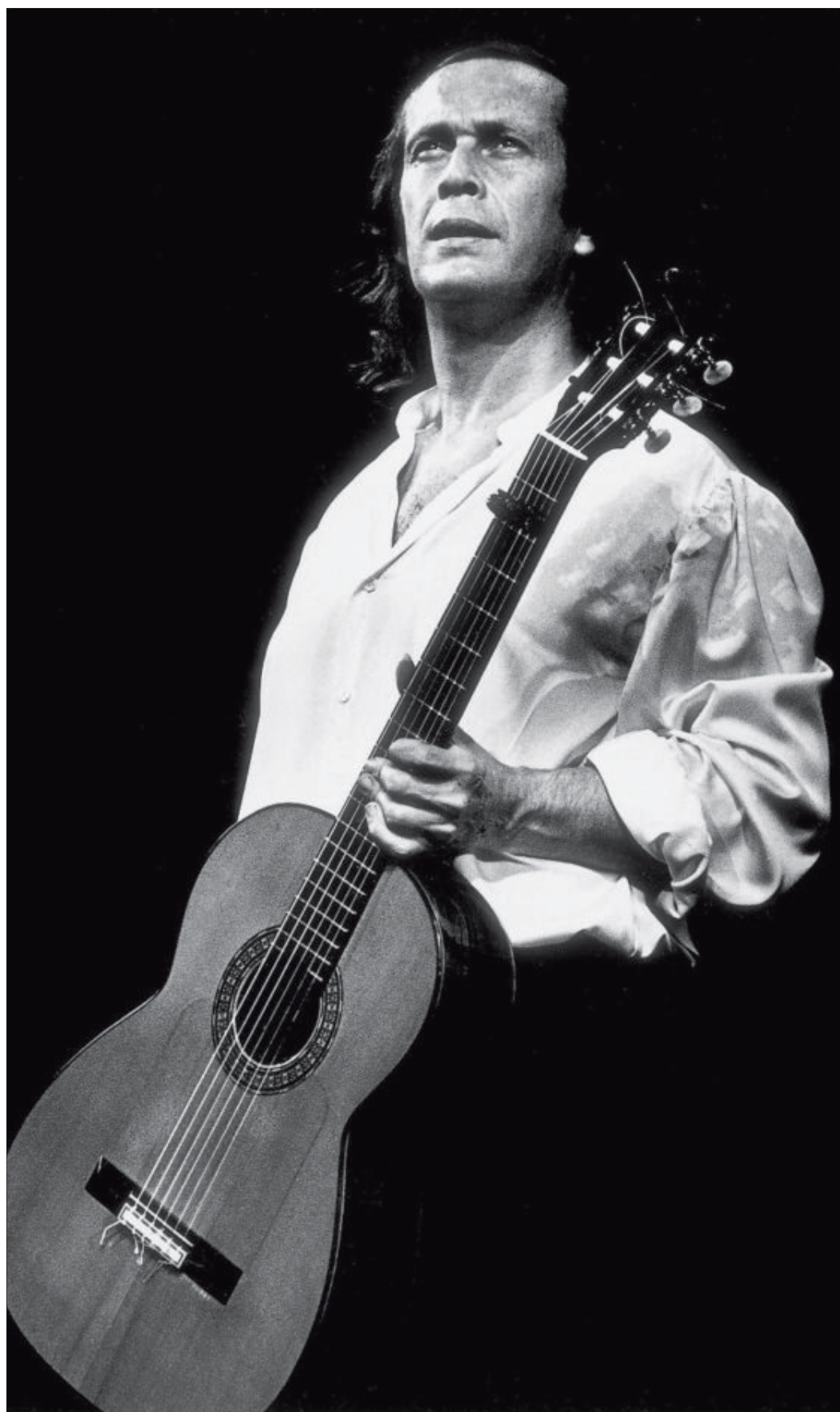
El tocaor de Algeciras, al término de un recital en Madrid en 1986.

se declaraba un cantaor frustrado —“el guitarrista que mejor canta soy yo”, decía—, profesó siempre por Camarón. En 2004, al grabar Cositas buenas , Paco de Lucía recuperó con Javier Limón una bulería inédita del genio de la Isla e invitó a Tomatito a meter su guitarra. Y contó: “Los dos llorábamos como tontos oyendo cantar a José. ¡Parecía que estaba vivo y acababa de irse a tomar café!”.