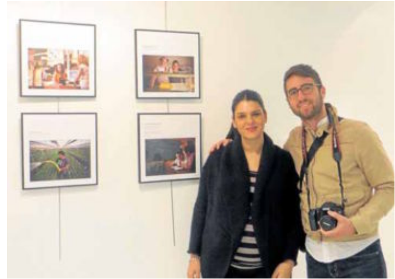
INAUGURACIÓN de la muestra fotográfica ‘El derecho a tener matices’, ayer en el IAJ.

Prisma de imágenes En las 26 fotografías de la muestra el espectador puede contemplar a gitanos y gitanas anda-