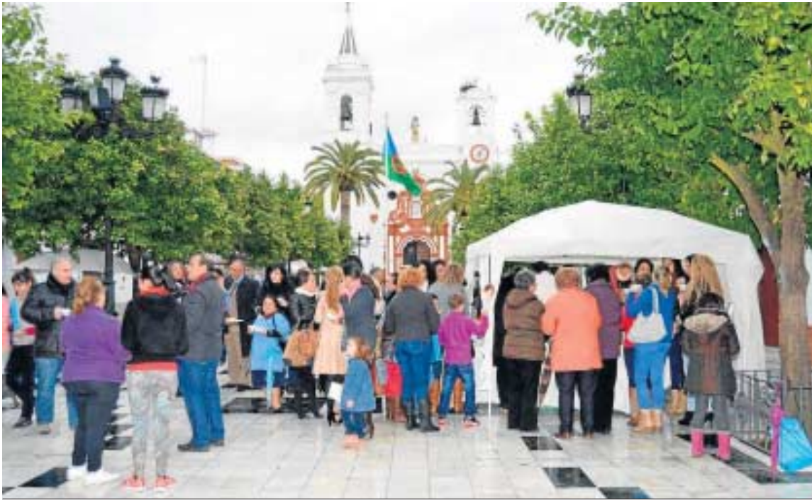
Carpa de la comunidad gitana instalada en la plaza de Almonte.