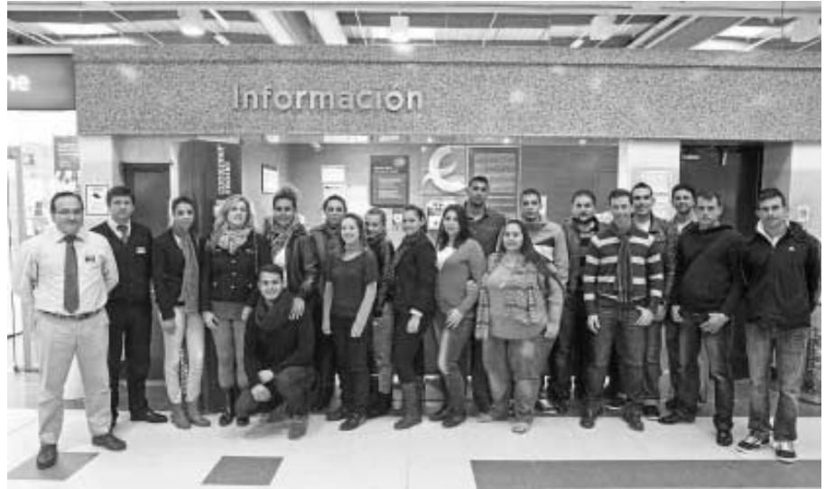
Los jóvenes que comenzaron ayer sus prácticas, en Eroski junto a responsables del centro y de la Fundación.

La actuación se enmarca en el Programa Operativo Plurirregional de Lucha contra la Discriminación del Fondo Social Europeo, con la colaboración de La Caixa.