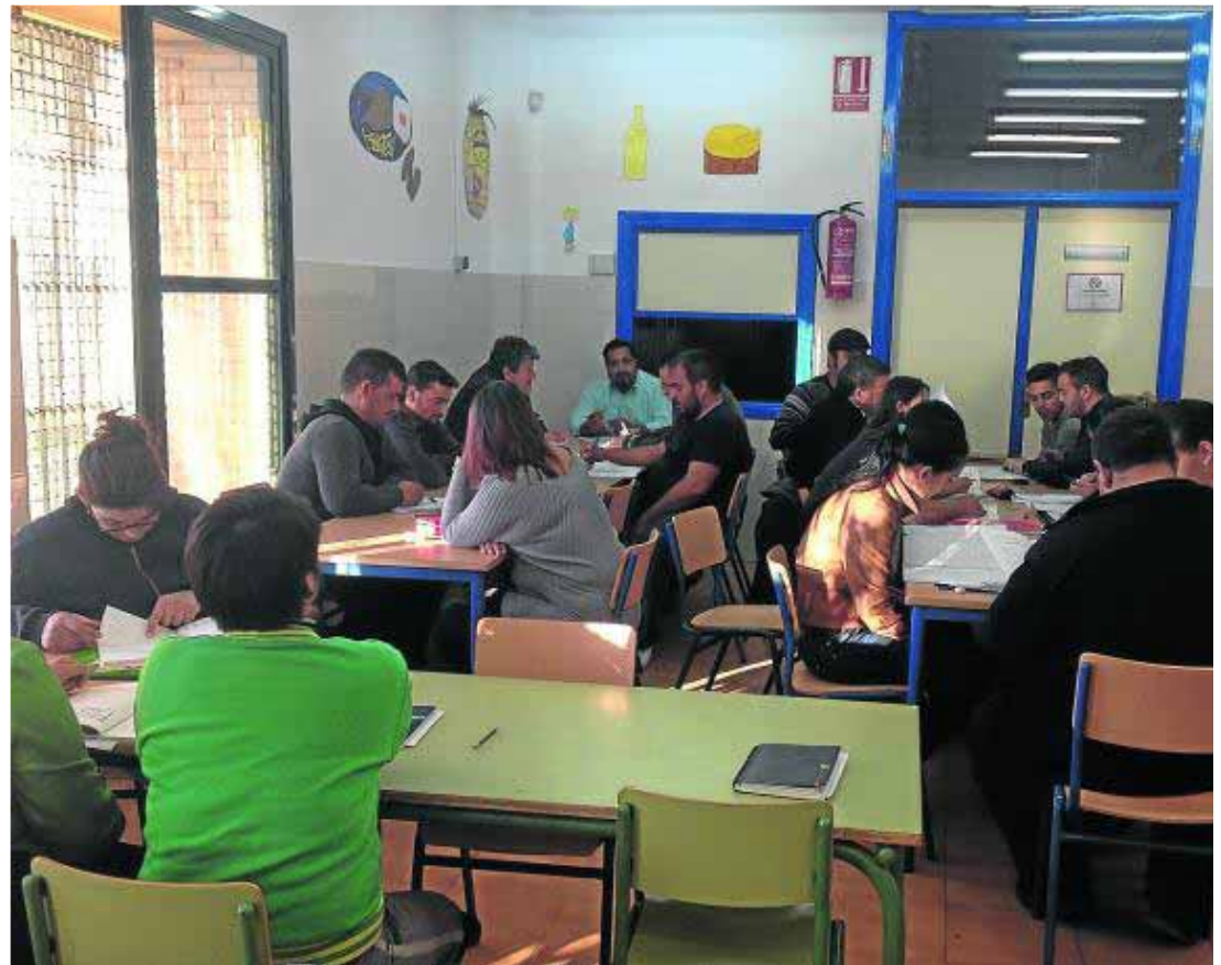
Uno de los talleres de lectura y escritura que se realizan ahora desde el CEIP Punta Entinas.

Y es que la obtención de esta subvención para la Asociación Pro Gitanos y para todo el barrio de Pampanico supone una de las últimas esperanzas para los más de 600 usuarios que hasta junio del pasado año hacían uso de estas instalaciones del Centro de Acceso Público a Internet. Sin duda, mucho más que un simple CAPI para Pampanico.