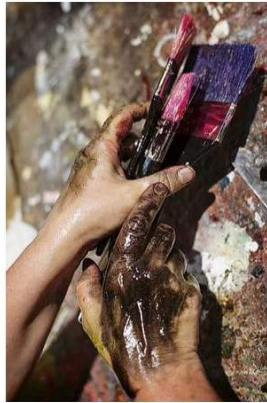
Arriba y a la izquierda, distintas fases del proceso de Cabellut para pintar un lienzo. A la derecha, en el salón de su casa-estudio en La Haya.