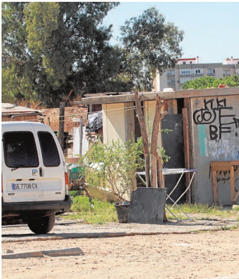
Vista general del asentamiento chabolista de El Vacie, junto al cementerio

Los alcaldes de Cádiz, Chiclana y Rota comenzaban la semana con un fuerte varapalo al conocer que los proyectos presentados por cada uno de sus ayuntamientos para optar a los fondos de la Estrategia de Desarrollo Urbano Sostenible e Integrado (EDUSI) habían sido rechazados por parte del Ministerio de Hacienda y Administraciones Públicas. Sin embargo, otras siete localidades de