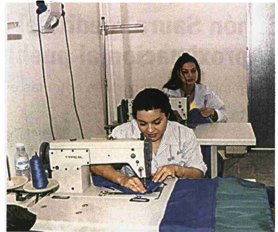
La fundación trabaja a favor de la inserción laboral de la mujer

En cuanto a la precariedad laboral, ésta también es mayor entre los gitanos, según la fundación. Un 70'9 por ciento de la población gitana tiene contratos temporales frente al 30'9 por ciento del resto de