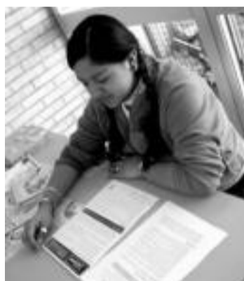
DIVERSIDAD. Esta comunidad tiene un mediador gitano y otro musulmán.