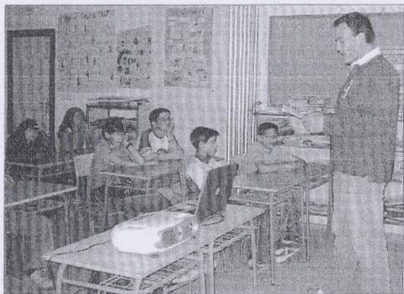
Campaña de sensibilización social en un centro educativo.