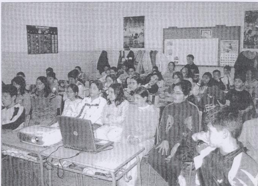
Miembros de FSG de La Roda y varios chicos y chicas de La Roda.