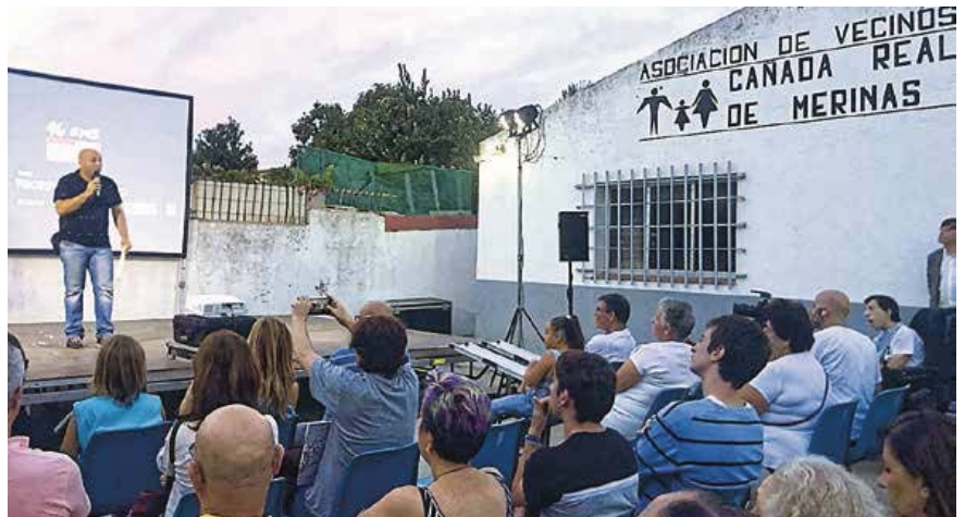
Presentación de una de las proyecciones y público asistente.

En esta edición, el festival ha tenido más afluencia que nunca, ha contado con más de 4.400 asistentes, de los cuales casi el 50% llega de otras zonas de Madrid, que iban a Cañada atraídos no solo por el cartel, también para conocer de primera mano una zona de la que se habla siempre con cierto desatino. Así, muchos de sus visitantes expresan sorpresa al llegar a Cañada Real y ver que no es como se lo pintaron, sino que se parece bastante a su propio barrio o su pueblo. Y eso es Cañada Real, un barrio más de Madrid, con una serie de particularidades so-