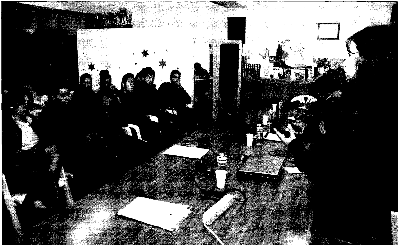
TALLERES. Charla de asesoramiento en la sede la Asociación de Vecinos Arrayanes.

Aunque la actual coyuntura económica se "ceba" con los colectivos más desfavorecidos, la formación y el apoyo que reciben de colectivos como Secretariado Gitano minimiza sus efectos