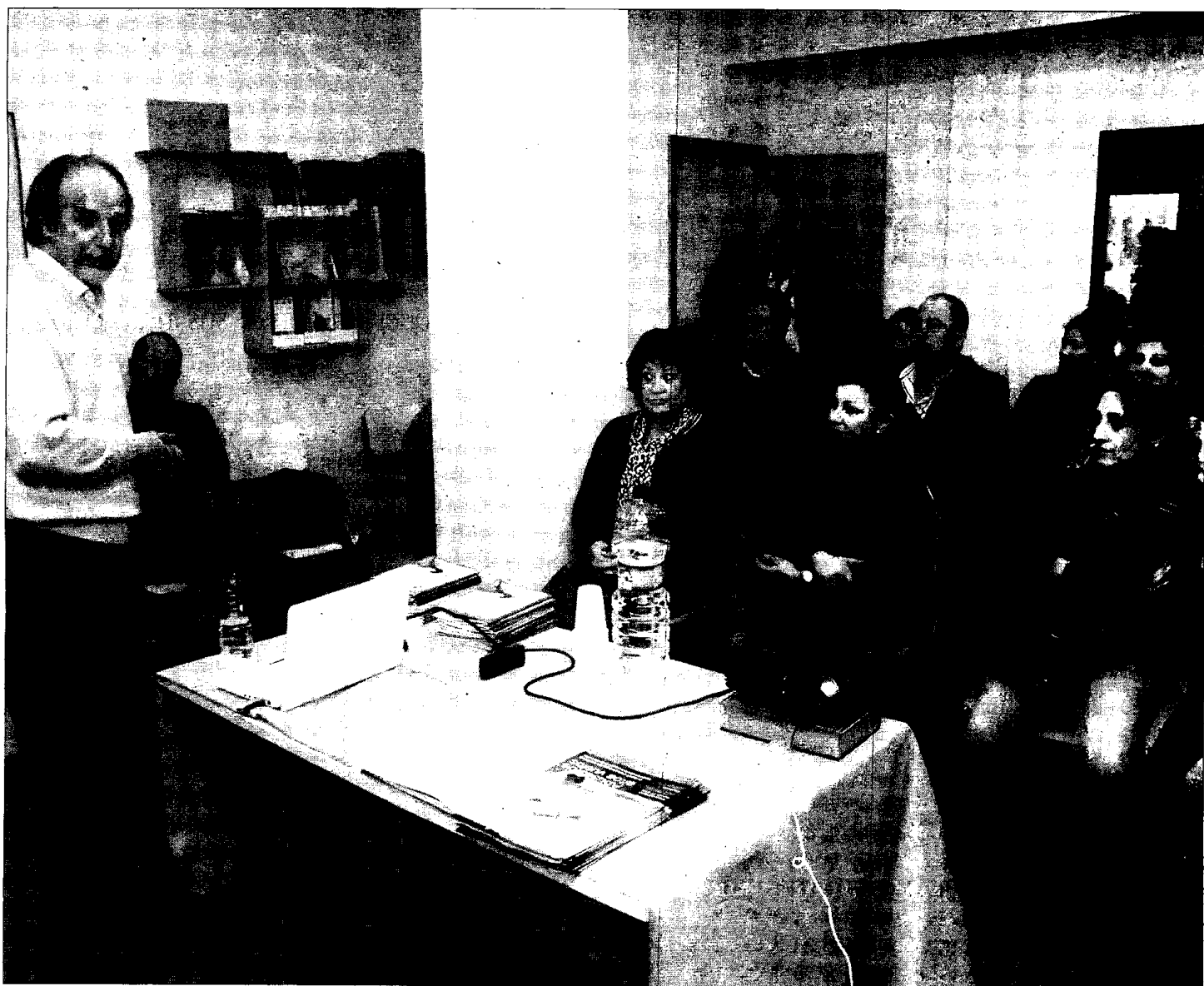
La orientación profesional es básica para acceder a nuevos cursos y actividades para desempleados.

con el colectivo en la formación y el empleo, también en colaboración con empresas importantes, un único objetivo, que es el de conseguir la igualdad de oportunidades. ■ PÁGINAS 32 Y 33