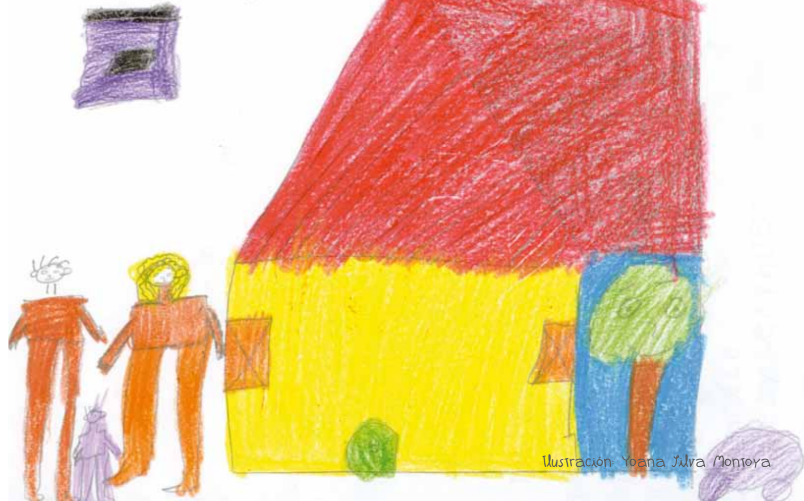
Ilustración: Yoana Julia Montoya

Un día mi abuela me contó que antes de nacer yo ella tenía una casa muy hermosa, era muy grande y vivía mucha gente, era la mejor casa del barrio pero un día vinieron unas grúas y la destruyeron....ahora vivo en una caravana.