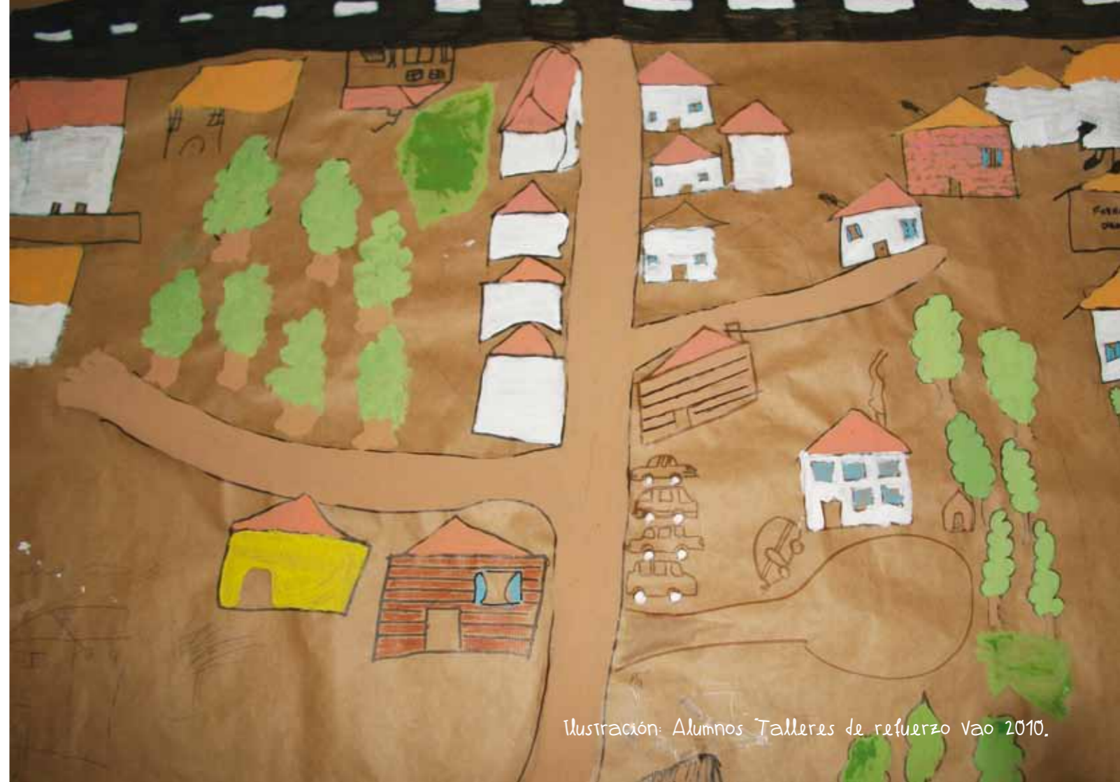
Ilustración: Alumnos Talleres de refuerzo Vao 2010.

Cuando se hace de noche a la luz del fuego imagino como me gustaría que fuera mi barrio, me gustaría que fuera más limpio, que las casas fueran más grandes y más ordenadas, que hubiera columpios, más árboles para poder subirme, que mi casa tuviera una habitación solo para jugar, con muchos juguetes, sobre todo "Barbis".