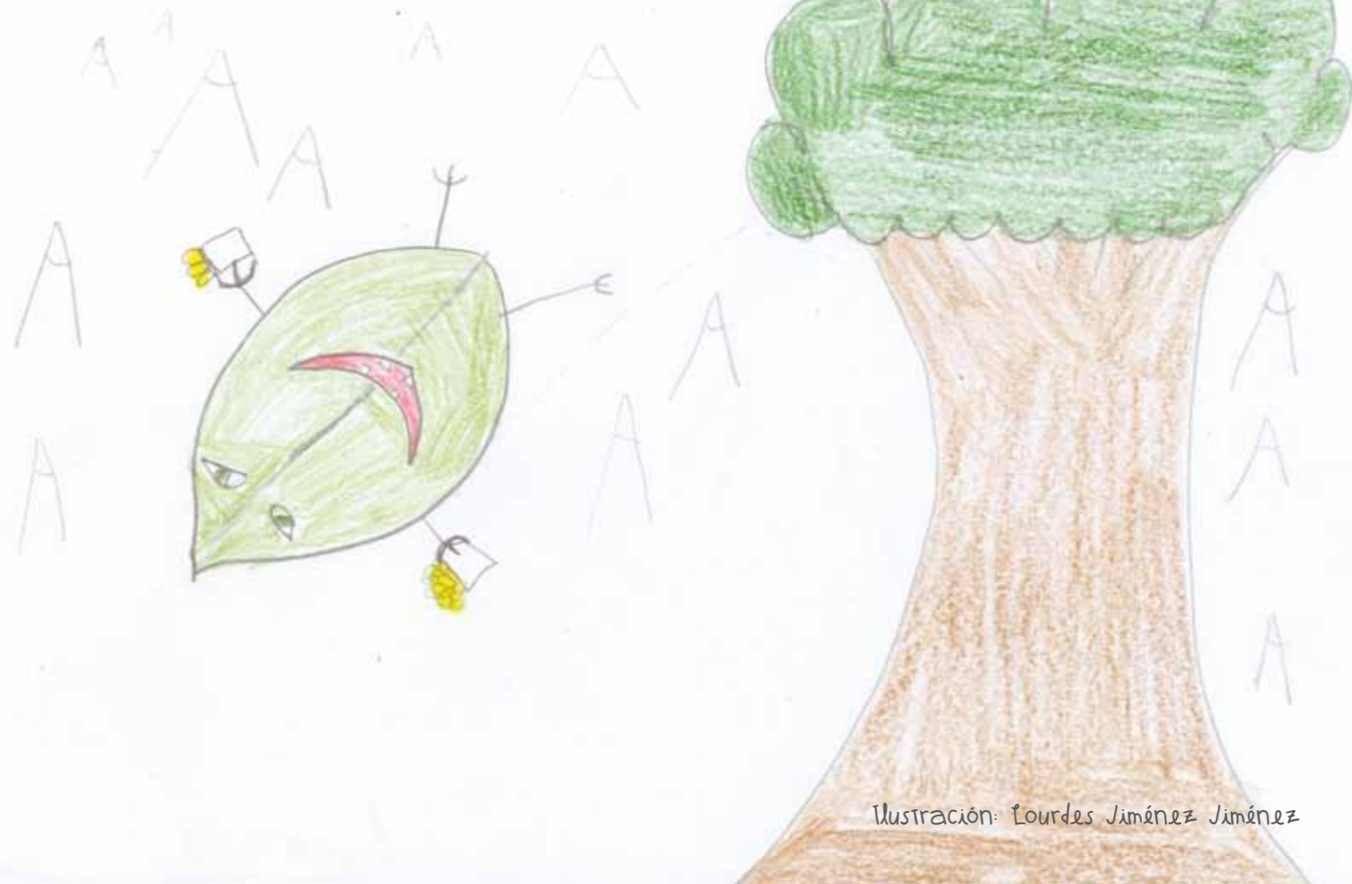
Ilustración: Lourdes Jiménez Jiménez