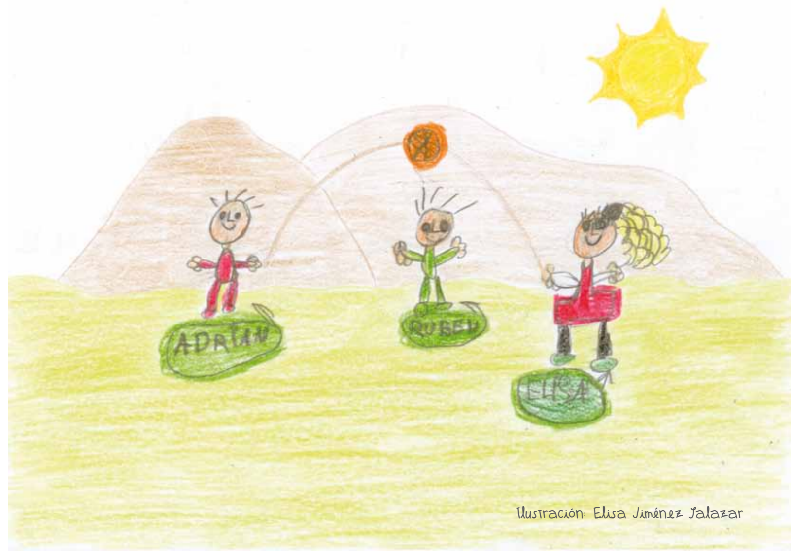
Ilustración: Elisa Jiménez Jalazar