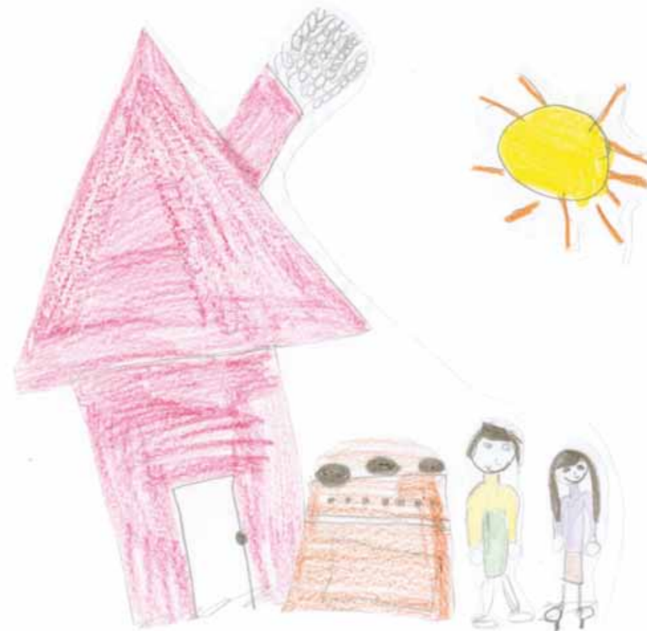
Ilustración: Alumnos Talleres de refuerzo Vao 2010.

Mi abuelo y yo también jugamos al domino, y cuando estamos muy contentos cantamos, a los gitanos nos gusta mucho cantar.